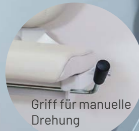
Griff für manuelle Drehung