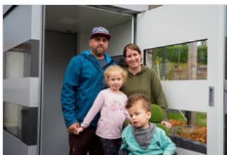
Neben "Eiterfeld bewegt sich" wurde die Familie durch zwei weitere Spendenaufrufe ...