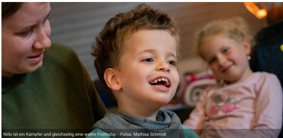
Niilo ist ein Kämpfer und gleichzeitig eine wahre Frohnatur.

EITERFELD Dieses Jahr für Nora und Filipa