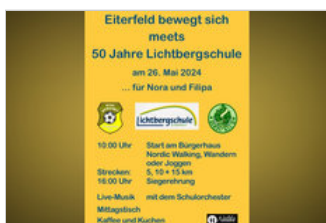
Dieses Jahr heißt es wieder Laufen für einen guten Zweck!