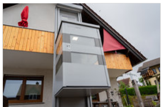
4.000 Euro wurden von der Krankenkasse dabei übernommen...