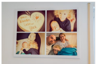
Ein gutes Motto.

laufen, stehen noch sprechen, versteht jedoch das meiste. Auch für seine Familie bedeutet die Krankheit eine Umstellung und Dauerbelastung. Wöchentlich muss er zwei bis drei Mal zu Therapien, wenn nicht anderweitige Termine in der Würzburger Klinik anstehen.